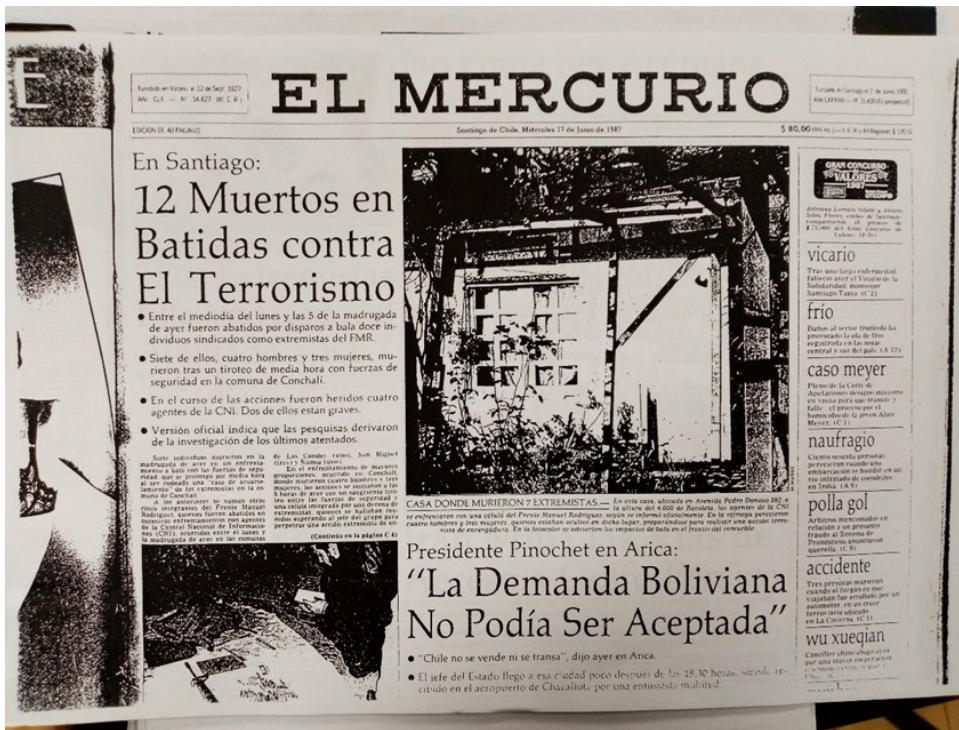
El Mercurio , 1987