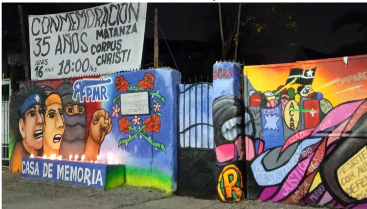
[Fundación Casa de Memoria y Resistencia: Corpus Christi, 2022]

Fundación Casa de Memoria y Resistencia: Corpus Christi, 16 de junio de 2022, acto conmemorativo de los 35 años de la Matanza de Corpus Christi.