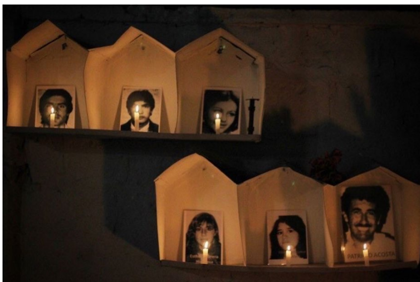
[Fundación Casa de Memoria y Resistencia: Corpus Christi, 2022]

Fundación Casa de Memoria y Resistencia: Corpus Christi, 16 de junio de 2022, acto conmemorativo de los 35 años de la Matanza de Corpus Christi, Pedro Donoso 258.